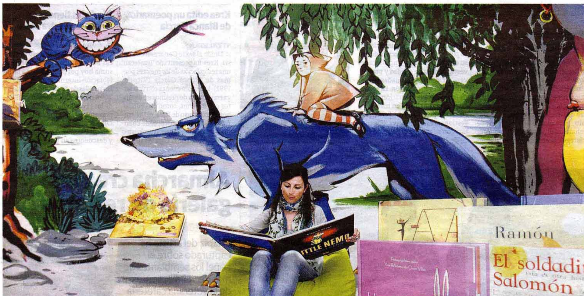
Una joven observa las ilustraciones de Winsor McCay en la sala de la muestra 'Cuentos imaginados. El arte de la ilustración infantil', en la biblioteca del Artium.