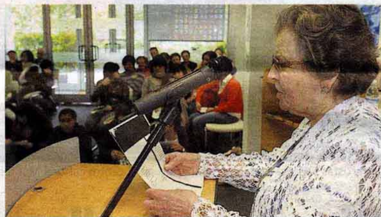
Arriba, la lectura poética en la Casa de Cultura Ignacio Aldecoa. Debajo, la Fundación Sancho el Sabio mostró sus fondos en su jornada de puertas abiertas. A la izquierda, parte de los textos de la lectura en el Artium.

La experiencia de 'bookcrossing' del Artium se ha exportado a 31 centros de España