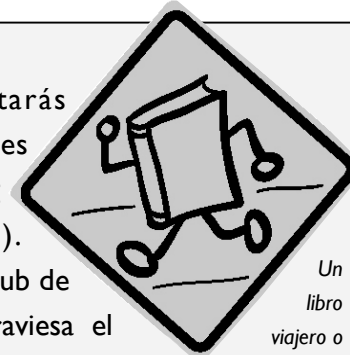
Un libro viajero o "liberado". La mascota de Bookcrossing

Te preguntarán qué es Bookcrossing (cruzando libros). Bookcrossing es un club de libros global que atraviesa el tiempo y el espacio. Es un grupo de lectura que no conoce límites geográficos. ¿Te gustan los libros? ¿Quieres compartir tus libros favoritos con otras personas? ¿Nunca has pensado en hacer que tus libros "viajen"?. Intercambiar libros nunca ha sido más excitante que con bookcrossing. Nuestra meta, simplemente, es convertir el mundo entero en una biblioteca. Bookcrossing es un intercambio de libros de proporciones infinitas, el primero y único de su clase.